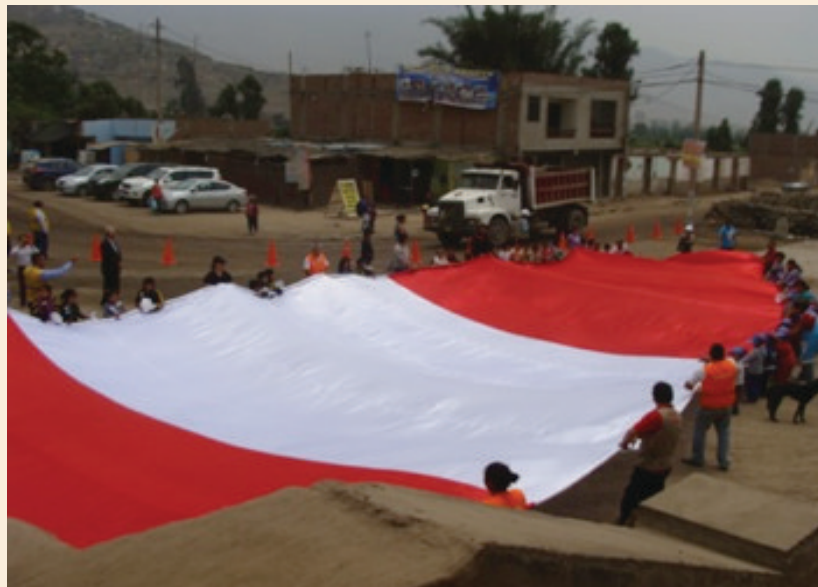
Niños y la bandera Peruana en la Casa Hacienda Santiago de Punchauca (diciembre de 2014)