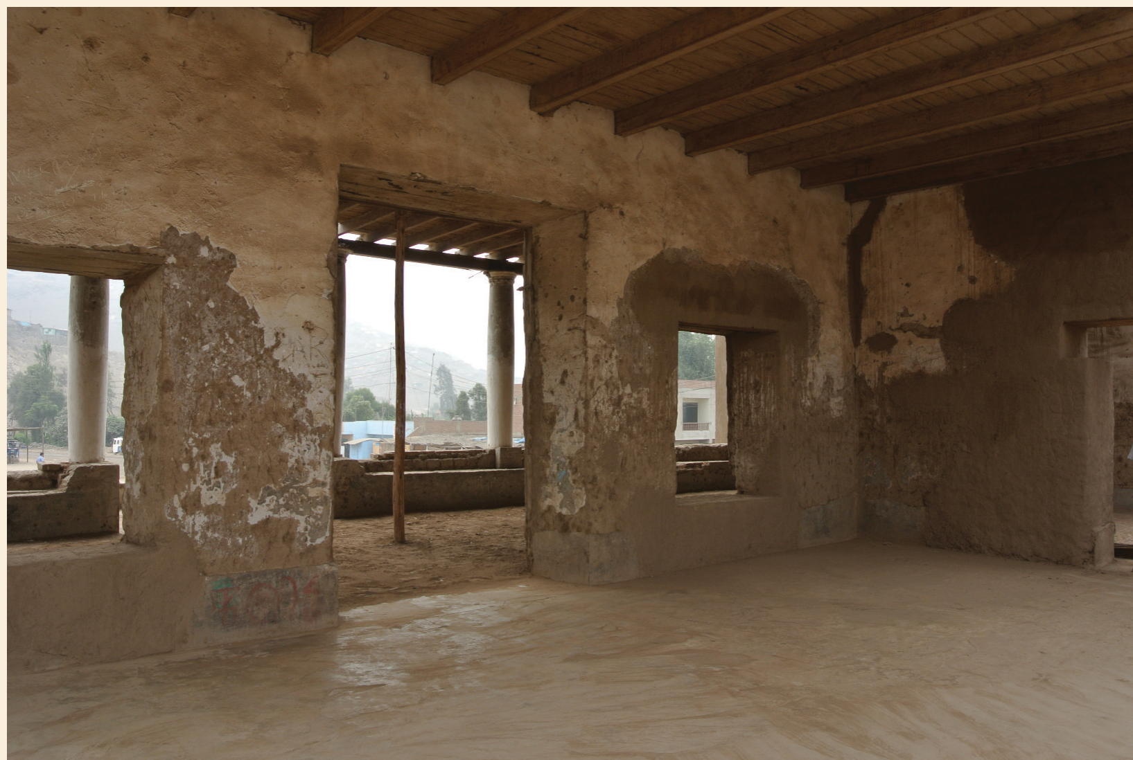
Vista interior, ambiente donde se llevo a cabo las conversaciones entre el General José de San Martín y el Virrey del Perú, General José de la Serna, nótese la ausencia total de componentes ornamentales (diciembre de 2014)