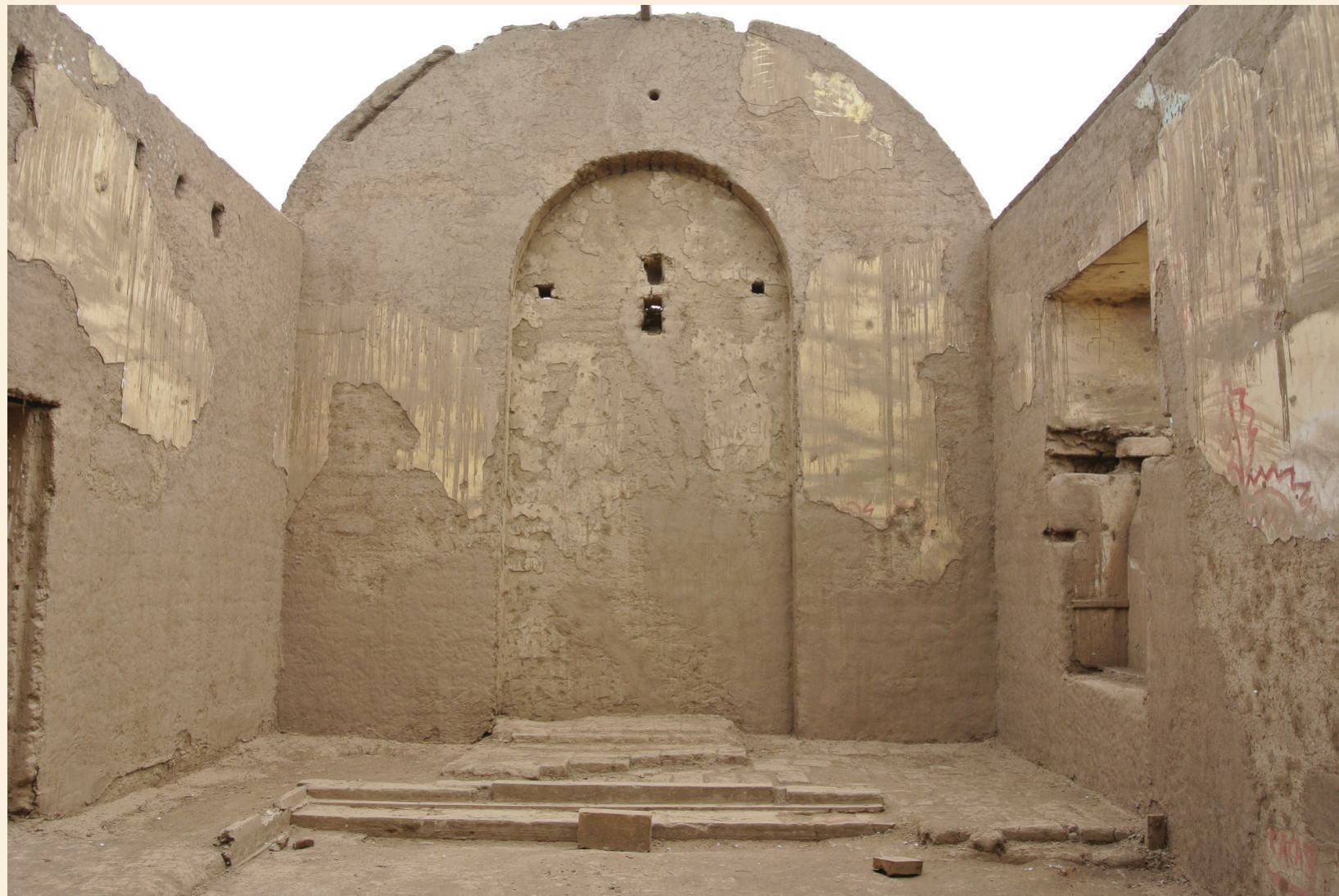
Vista de la Capilla, nótese la ausencia total de componentes ornamentales (diciembre de 2014)

Elaborado siguiendo el Manual de referencia para el Método de Gestión de Riesgos del ICC-ICCROM-RCE