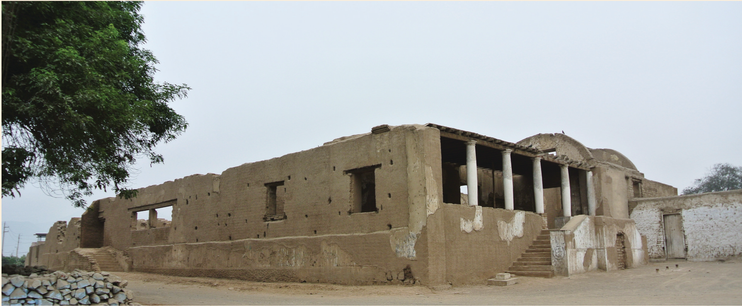
Vista general exterior (diciembre de 2014)

Ubicada en el distrito de Carabayllo-Lima, a 32 Km del Centro Histórico de Lima. Según señala el Ministerio de Cultura (2013) la casa y capilla de la Hacienda Santiago de Punchauca poseen un valor histórico, dado que “esta edificada sobre un antiguo oratorio Colli o Collique dedicado al Sol o ‘Punchao’, es un testimonio relevante de la historia social y económica de la ciudad de Lima y del desarrollo de la arquitectura rural y de las haciendas de la época virreinal. Suma a estos valores otro de carácter histórico político, ya que el 2 de junio de 1821 fue sede de las últimas conversaciones de paz que sostuvieron las fuerzas patriotas y realistas representadas por el General José de San Martín y el Virrey del Perú, General José de la Serna, en un último intento de evitar la continuación del conflicto; este suceso preludia el abandono de Lima por las fuerzas realistas y la proclama de la independencia, (...)”