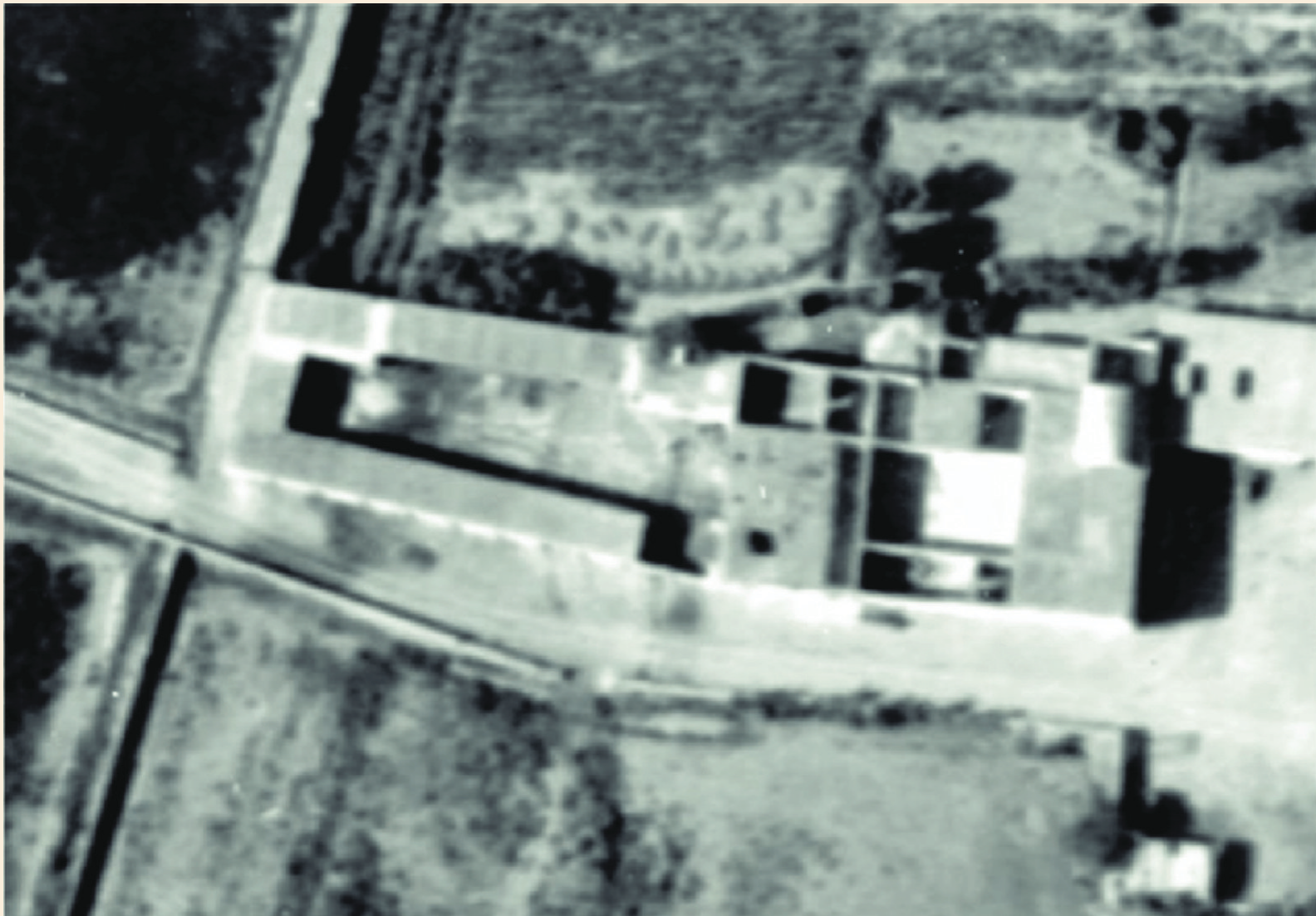
Fotografía aérea de la Casa Hacienda Santiago de Punchauca, Servicio Aerofotográfico Nacional (1945) (**) En ese año se encontraban gran parte de los ambientes que formaban parte de la Hacienda

Se ha considerado el agente de deterioro robo y vandalismo, porque la normativa peruana esta orientada sobre todo a los riesgos por desastres (sismos, inundaciones, etc.). Sin embargo, como se aprecia en este caso, el agente analizado resulta ser relevante si no se controlado a tiempo, ya que puede llevar a la pérdida casi total de un bien patrimonial.