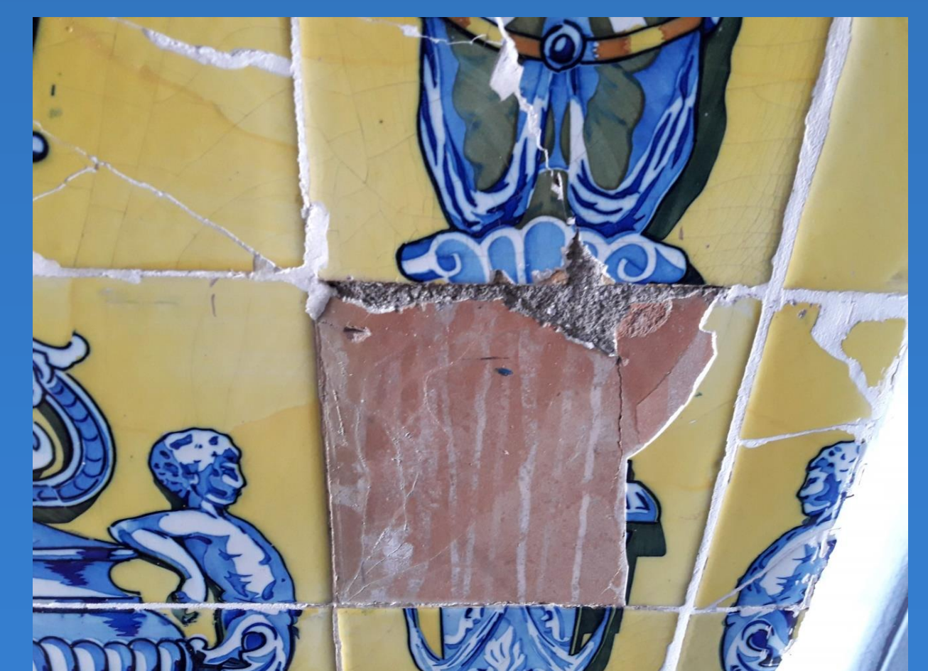
Detalhe do azulejo com danificado.

Exemplo de tabela com base na utilizada pelo Monumentenwacht (VANDESANDE, VAN BALEN, 2016)