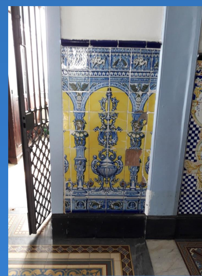
Azulejos da sacristia.